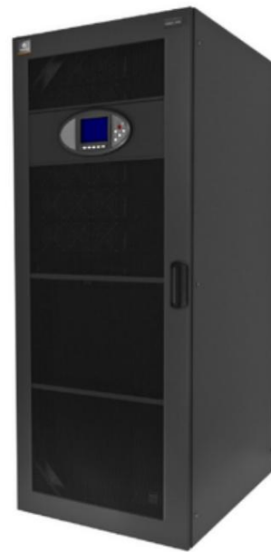
Vertiv™ Liebert® APM 30 - 150 kVA